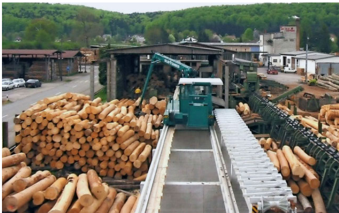
Abb. 3: Die Corbat-Holding SA, Vendlincourt (JU), hat sich auf Laubholz spezialisiert und bietet neben Eichenschnittwaren auch Schwellen und Parkett an.