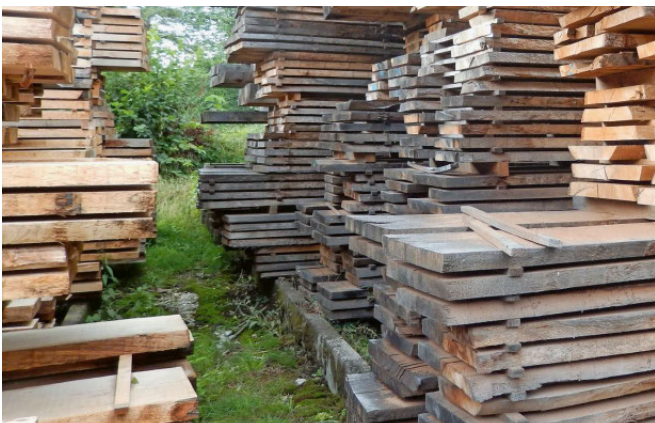
Abb. 7: Um die Rissbildung zu vermindern, wird Eichenholz langsam getrocknet und entsprechend dem Einsatzzweck oft jahrelang gelagert.