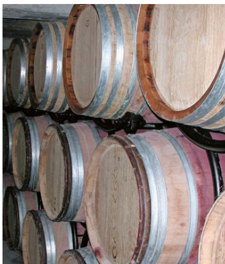
Abb. 5: Die Herstellung von Weinfässern aus Eichenholz begründet eine informelle Interessengemeinschaft für die Eiche, welche Grundlage für die Bildung von Eichentradition darstellt.

Als Musterbeispiel für die Entwicklung von lokalen Holzketten kann die Herstellung von Weinfässern aus einheimischem Eichen-