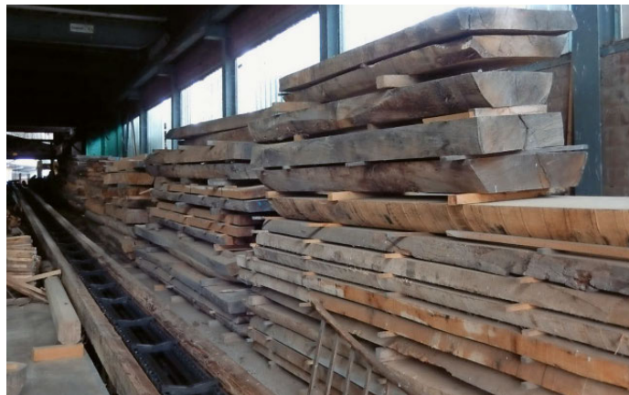
Abb. 4: Die Hanhartholz AG, Diessenhofen (TG), hat sich auf den Einschnitt von Laubhölzern bzw. Eiche spezialisiert und bietet auch besondere Dimensionen an.