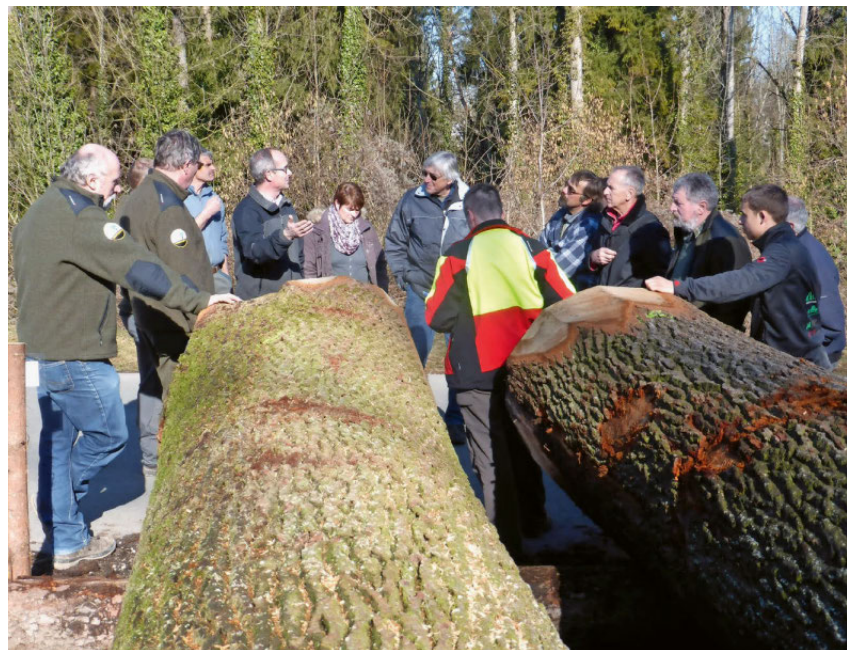
Abb. 1: Der Förster empfindet den erfolgreichen Holzverkauf als krönenden Abschluss eines jahrhundertelangen Produktionsprozesses, an dem er selber mitwirken durfte.

Das in der Schweiz gehandelte und verarbeitete Eichenholz stammt teils aus heimischer Produktion und teils aus dem Import. Die für die Wertholzproduktion wesentlichen Stiel- und Traubeneichen weisen gemäss Landesforstinventar (LFI4) ein Derbholumen (Durchmesser >7 cm) von rund 7,3 Mio. m 3 auf, was 1,7% des Vorrates des Schweizer Waldes entspricht. Der jährliche Zuwachs der beiden Haupteichenarten liegt bei 121 000 m 3 . Rund 80% dieses Zuwachses können gemäss LFI2 wüchsigen Standorten des Wirtschaftswaldes 2 zugeordnet werden. Nach Abzügen für Rinde (22%) und Ernte-